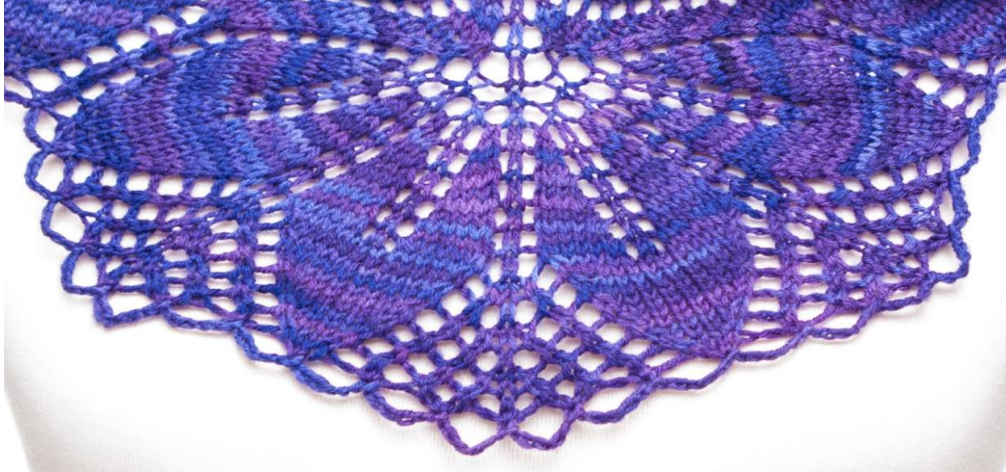
MUNSTUR B- Yfirlit

Eftir 4 endurtekningar þá hefur þú 12 stafi á hvorn helming og alls 249 lykkjur. Stafurinn er slétta lykkjan á milli lóðréttu uppsláttarparanna. Ef þú vilt gera þetta sjal stærra eða jafnvel minna, þá þrjónar þú einfaldlega fleiri eða færri endurtekningar í þessum hluta. Hver endurtekning bætir við 40 lykkjum. Gakktu úr skugga að vera með slétta tölu í stafafjölda áður en þú færir þig yfir í teikningu B. Gerðu ráð fyrir um það bil 50% af garni í teikningu B.